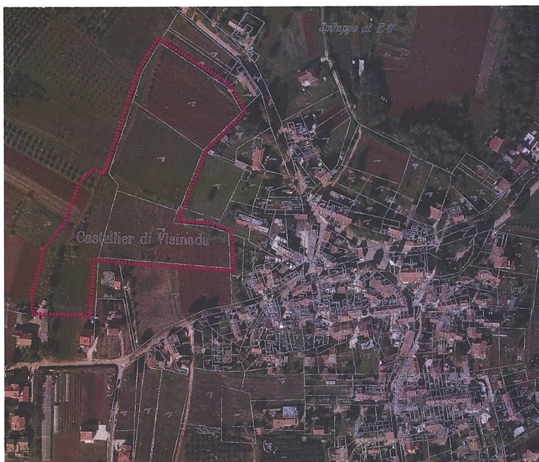
Obuhvat Plana prikazan na orto-foto snimku